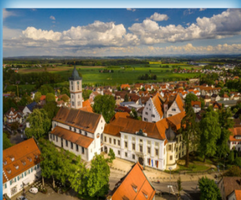
Schlosskirche St. Martin