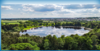
Steegersee (Naturbadesee ca. 5 Gehmin. vom Bahnhof)