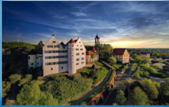
Schloss Aulendorf (verschiedene Baustile)