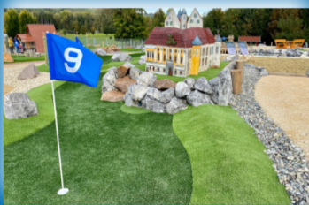
Adventure Golf Tiergarten (ca. 15 Gehminuten vom Bahnhof)