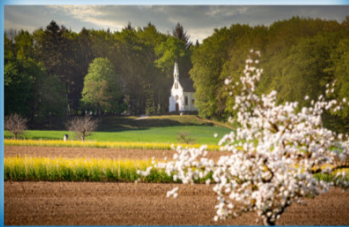
Hohkreuzkapelle (Aussichtspunkt Atzenberg)